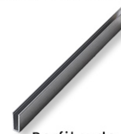
Perfil u de aluminio