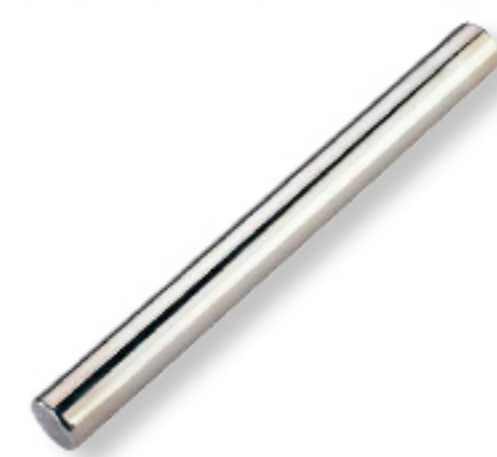
Barra de acero